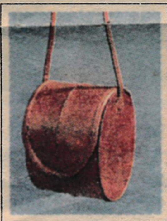
Veski úr steinbítsroði eftir Arndísi

smíði í Hollandi, og selur margskonar tréhluti í búðinni, frá litlum trédýrum uppí stærri húsgögn. „Litlu og ódýrari hlutirnir seljast mest, enda er fólk oft að leita að lítilli og sérstakri tækifærissgjöf. En það er hægari sala í stærri og dýrari hlutunum og fólk kaupir þá frekar fyrir sjálft sig. Annars greiðir góð sala í litlu hlutunum fyrir að frekar er hægt að nostra við stóru og vandadri hlutina, án þess að tapa á þeim.“